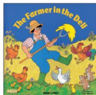
The Farmer in the Dell