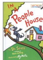
In a People House